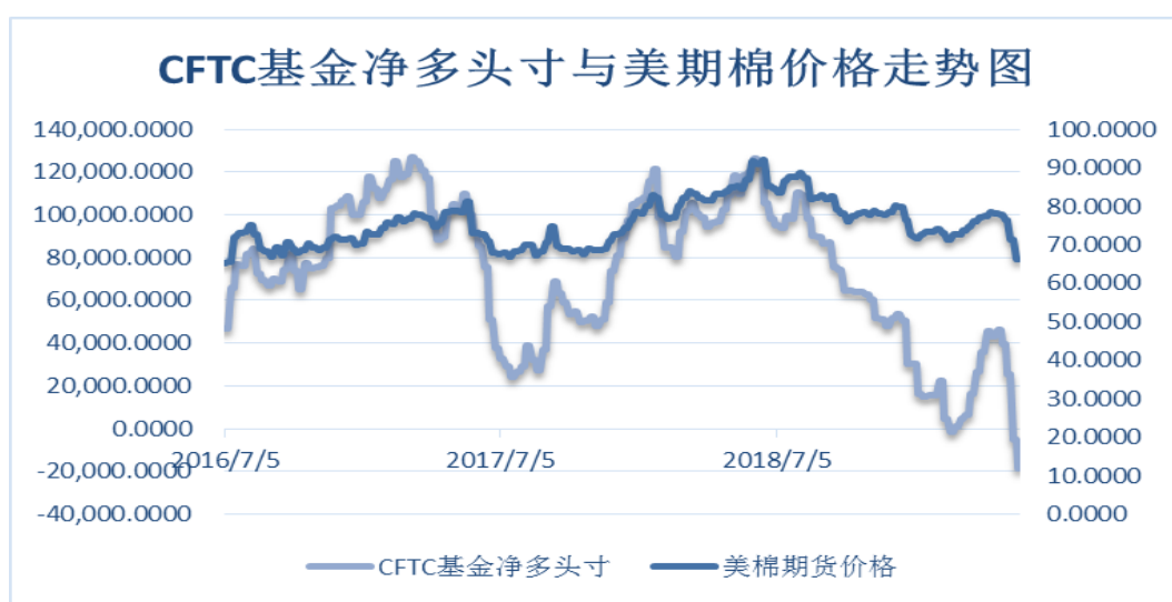
图 7、ICE 非商业净多头持仓