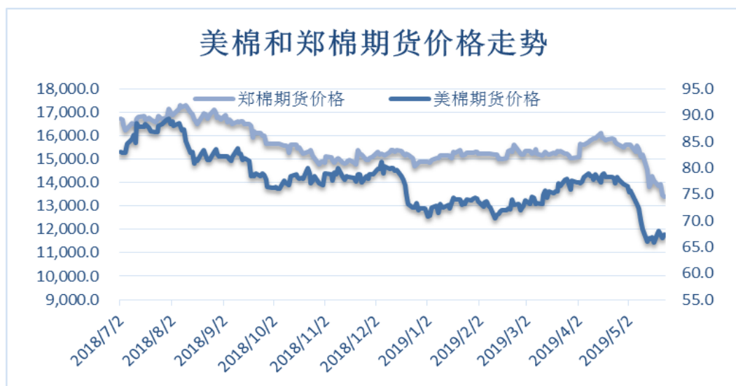
图 4、郑棉与美棉价格走势图