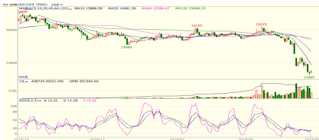
图 1、郑棉主力合约价格走势图

本周郑棉下跌，至周五收盘跌 580 至 13505，跌幅为 4.12%。周五中国棉花价格指数为 14621 元/吨，与上周相比下跌 340 元/吨。下游需求不佳，市场情绪悲观，棉价承压。从技术面来看，MACD 绿柱缩小，KDJ 低位向上，预计短期棉价可能震荡反弹。