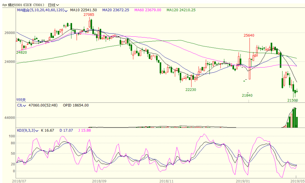
图 3、棉纱主力合约价格走势图

本周棉纱下跌,至周五跌 1150 至 21925,跌幅为 4.98%,中国纱线价格指数 C32S 为 22450 元/吨,与上周相比下跌 300 元/吨。下游需求不佳,纱布库存增加,压制棉纱价格。从技术面来看,MACD 绿柱缩小,KDJ 低位向上,预计短期棉纱价格可能震荡反弹。