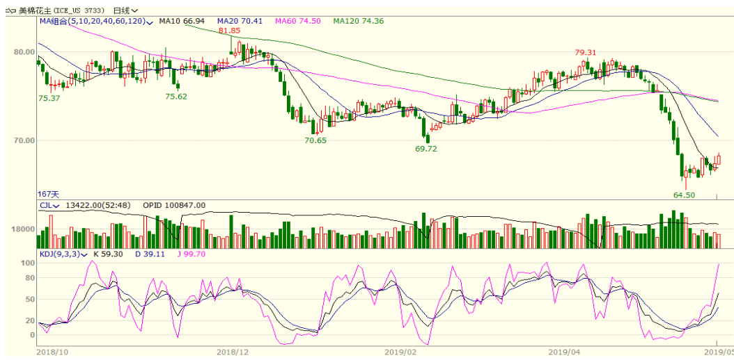
图 2、美棉主力合约价格走势图

外盘，本周美棉上涨，至周五涨 2.45 至 68.31，涨幅为 3.72%。三角洲地区棉花总进程大幅落后及美棉出口销售增长支撑棉价。从技术面来看，MACD 绿柱缩小，KDJ 向上，预计短期美棉可能震荡反弹。