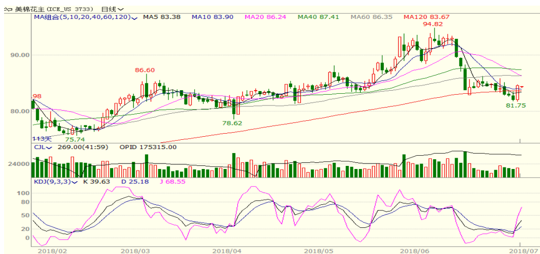
图 2、美棉主力合约价格走势

外盘，本周美棉震荡上涨，至周五涨 0.55 至 84.60，涨幅为 0.65%。本周中美第一轮加征关税正式实施，美棉下年度出口回升，棉价反弹。从技术面来看，MACD 绿柱缩小，KDJ 金叉向上，预计短期美棉可能继续震荡反弹，支撑位 82 美分附近。