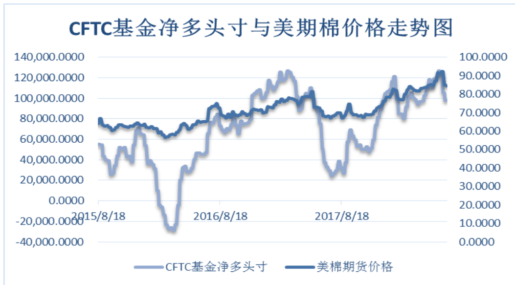
图 4、ICE 非商业净多头持仓