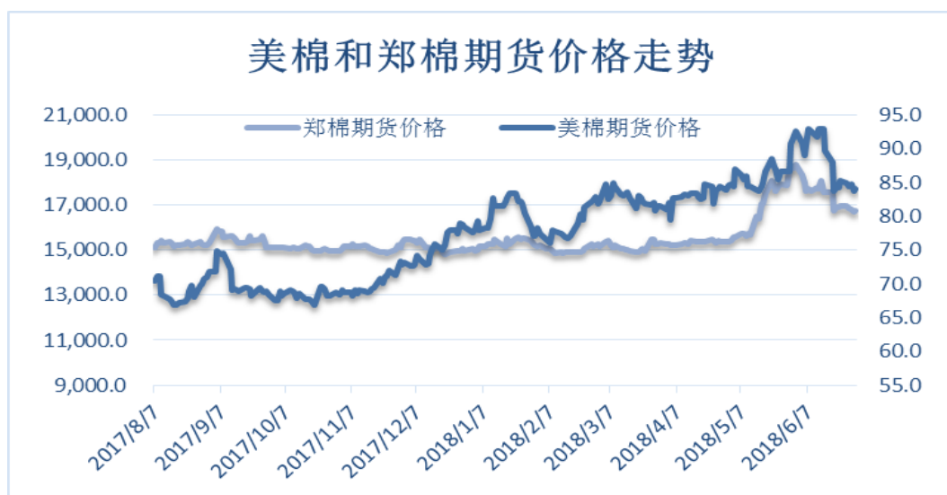
图 4、郑棉与美棉价格走势图