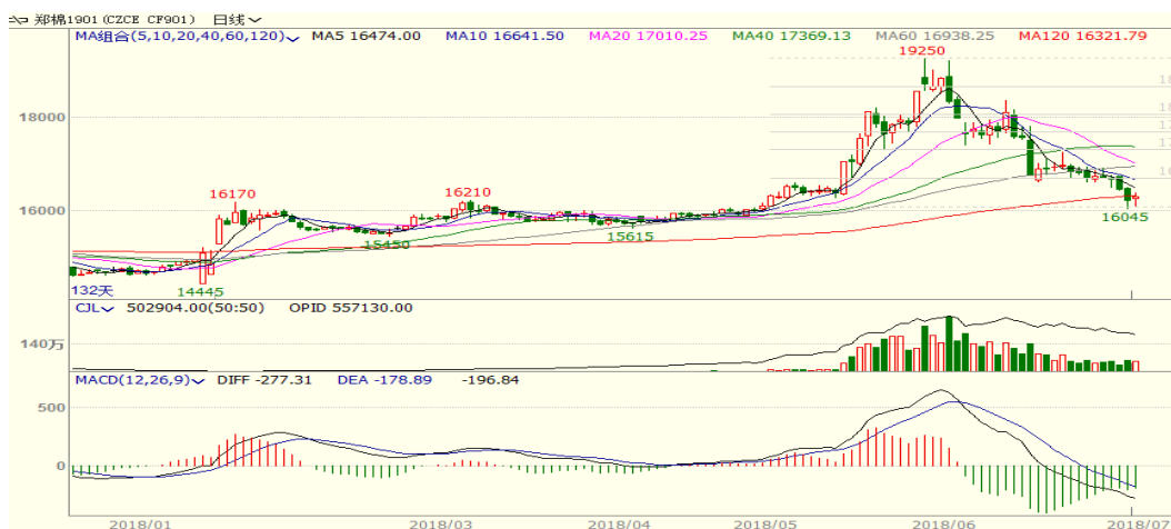
图 1、郑棉主力合约价格走势

本周，郑棉震荡下跌，至周五收盘跌 435 至 16300，跌幅为 2.60%。周五中国棉花价格指数为 16223 元/吨，与上周相比下跌 103 元/吨。本周中美贸易摩擦继续影响棉花市场，棉价震荡走低。从技术面来看，MACD 绿柱缩小，KDJ 低位金叉，预计短期棉价可能震荡反弹，支撑位 16000 附近。