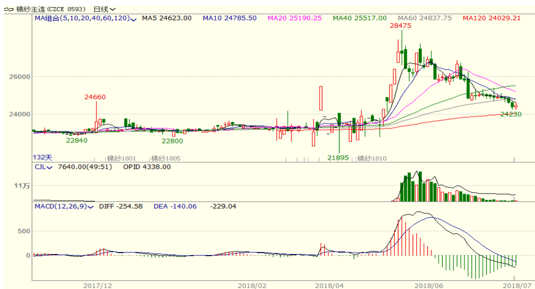
图 3、棉纱主力合约价格走势图

本周棉纱下跌，至周五跌 425 至 24455，跌幅为 1.71%，中国纱线价格指数 C32S 为 23840 元/吨，与上周相比下跌 10 元/吨。受中美贸易摩擦影响及纺织品服装市场逐步进入淡季，棉纱价格继续承压。从技术面来看，MACD 绿柱缩小，KDJ 低位金叉，预计短期棉纱价格可能震荡反弹。