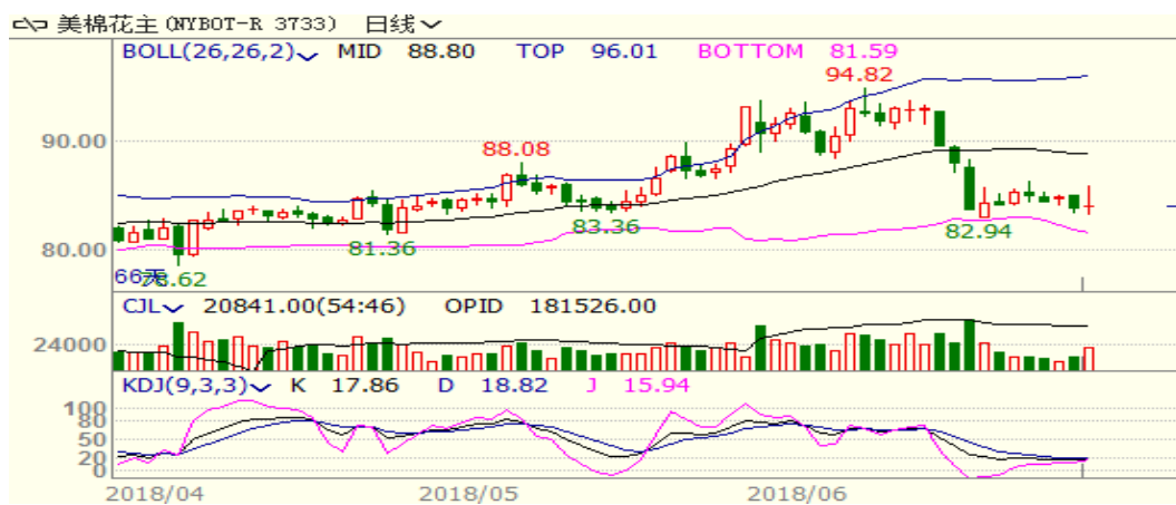
图 2、美棉主力合约价格走势

外盘，本周美棉下跌，至周五跌 1.27 至 84.05，跌幅为 1.49%。本周出口销售低迷及中美贸易摩擦继续施压棉价。从技术面来看，MACD 绿柱缩小，KDJ 低位，预计短期美棉可能震荡反弹，支撑位 82 美分附近。