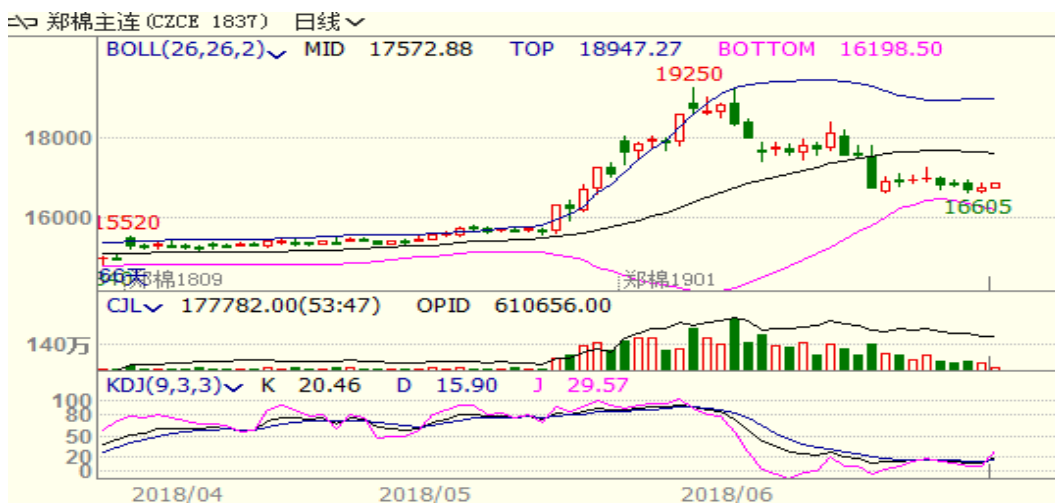
图 1、郑棉主力合约价格走势

本周，郑棉震荡下跌，至周五收盘跌 200 至 16735，跌幅为 1.18%。周五中国棉花价格指数为 16326 元/吨，与上周相比下跌 27 元/吨。本周中美贸易摩擦继续影响棉花市场，棉价震荡走低。从技术面来看，MACD 绿柱缩小，KDJ 低位金叉，预计短期棉价可能震荡反弹，支撑位 16400 附近。