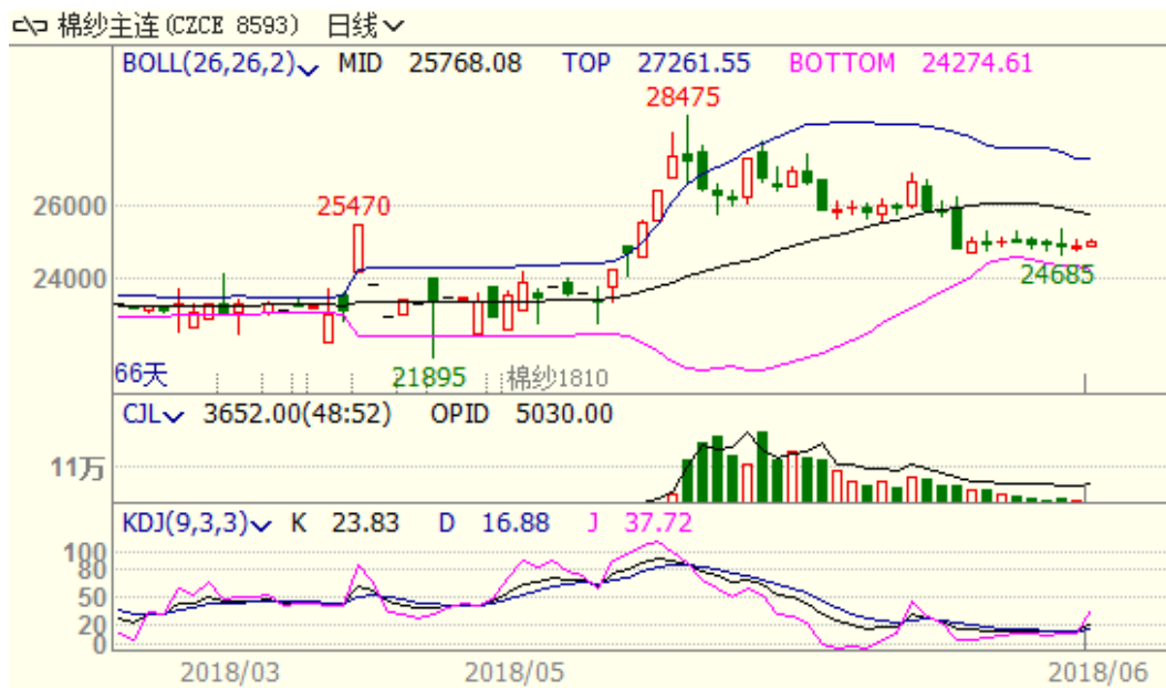
图 3、棉纱主力合约价格走势图

本周棉纱下跌，至周五跌 135 至 24880，跌幅为 0.54%，中国纱线价格指数 C32S 为 23850 元/吨，与上周相比下跌 10 元/吨。受中美贸易摩擦影响及纺织品服装市场逐步进入淡季，棉纱价格继续承压。从技术面来看，MACD 绿柱缩小，KDJ 低位金叉，预计短期棉纱价格可能震荡反弹。