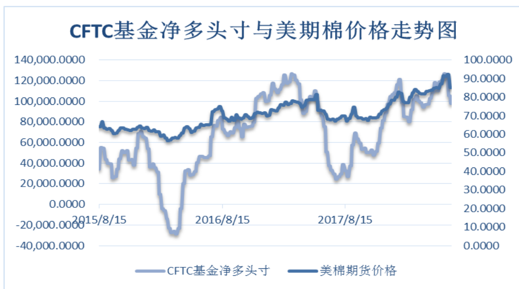
图 4、ICE 非商业净多头持仓

中美贸易摩擦第一批加征关税清单将于 7 月 6 日开始，且近期出口销售大幅回落，基金净多头持仓继续回落。