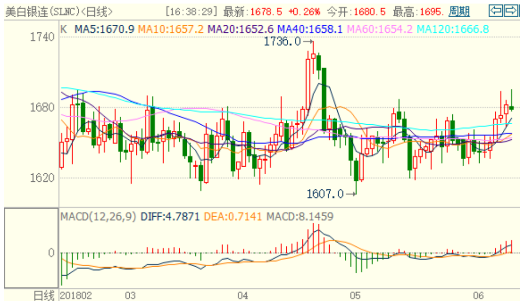
图 2：COMEX 白银主力合约技术分析