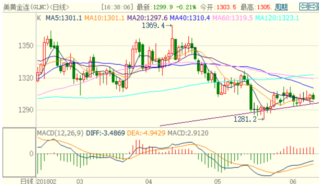
图 1：COMEX 黄金主力合约技术分析

COMEX 黄金上周在 1300 美元/盎司附近震荡，并且持续在趋势线附近止跌，技术指标偏多，本周黄金或震荡上涨，建议止损线设置在趋势线下方。