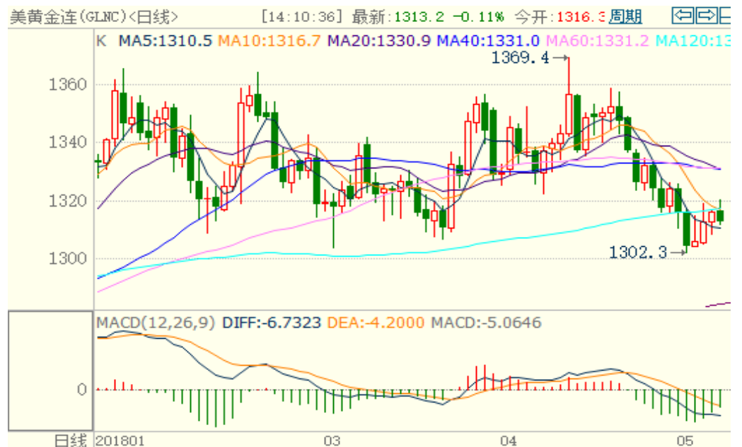
图 1：COMEX 黄金主力合约技术分析

COMEX 黄金上周先跌后涨，下方支撑位 1300 美元/盎司，技术指标偏多，预计本周或震荡上涨。