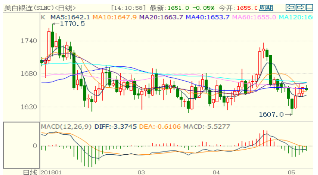
图 2：COMEX 白银主力合约技术分析