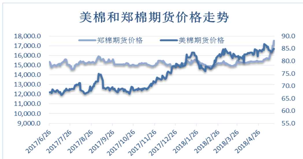
图 4、郑棉与美棉价格走势图