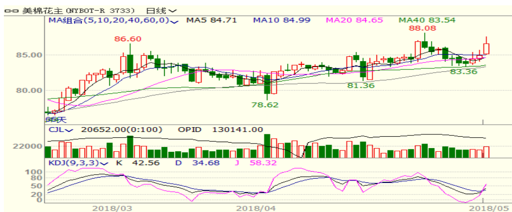
图 2、美棉主力合约价格走势

外盘，本周美棉上涨，至周五涨 2.12 至 86.58，涨幅为 2.51%。美棉播种加快且出口销售回落，棉价承压，但是郑棉上涨带动美棉上涨，且美西南棉区旱情依旧、中美贸易达成共识，利多美棉市场。从技术面来看，MACD 金叉，KDJ 金叉，预计短期美棉可能震荡向上，但 88 美分附近存在一定的压力。