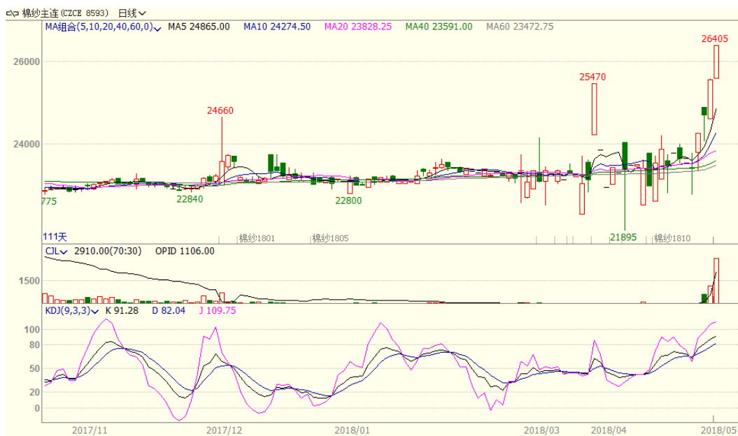
图 3、棉纱主力合约价格走势图

本周棉纱上涨,至周五涨 1920 至 25560,涨幅为 8.12%,中国纱线价格指数 C32S 为 23350 元/吨,与上周相比上涨 190 元/吨。本周棉花上涨带动棉纱市场回温,近期下游纺企利润普遍好去往年,纱线需求较好,库存低位,支撑棉纱价格。从技术面来看,本周棉纱上涨,MACD 红柱扩大,KDJ 向上,预计短期棉纱价格可能仍呈震荡偏强走势。