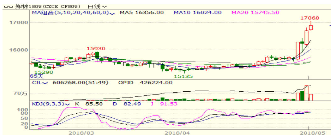
图 1、郑棉主力合约价格走势

本周，郑棉大幅上涨，至周五收盘涨 1030 至 16700，涨幅为 6.57%。周五中国棉花价格指数为 15690 元/吨，与上周相比上涨 165 元/吨。本周国储棉轮出成交率与成交均价均大幅上升，且新疆部分地区遭遇降温与风灾，支撑棉价。从技术面来看，MACD 红柱扩大，KDJ 向上，但 17000 附近阻力较大，预计短期棉价可能震荡偏强，支撑位 16000 附近。