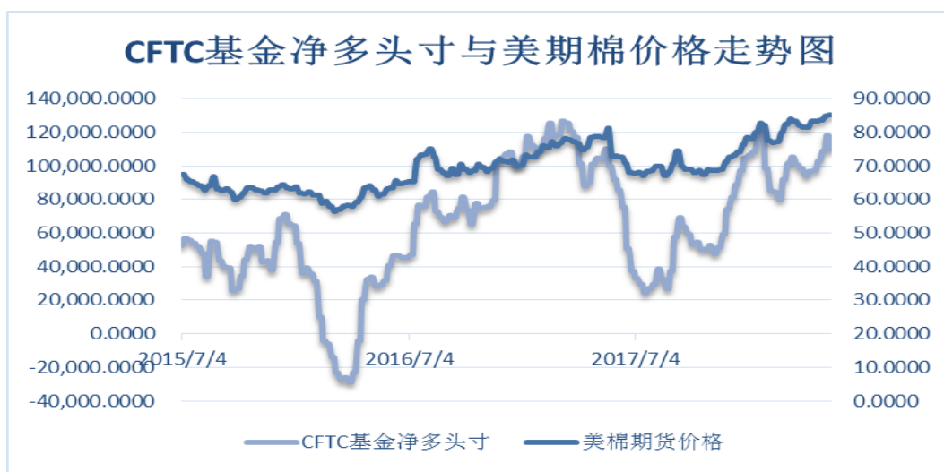
图 4、ICE 非商业净多头持仓

德州核心地区干旱且棉花需求较好继续推动棉花价格上涨，基金净多头持仓亦持续回升至 1 月底以来高位。