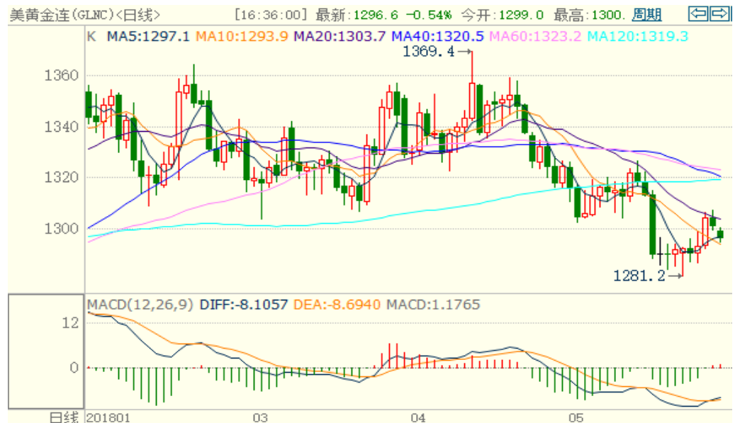
图 1：COMEX 黄金主力合约技术分析

COMEX 黄金上周上涨至 1300 美元/盎司的压力位，本周或震荡下跌，不建议继续做多。