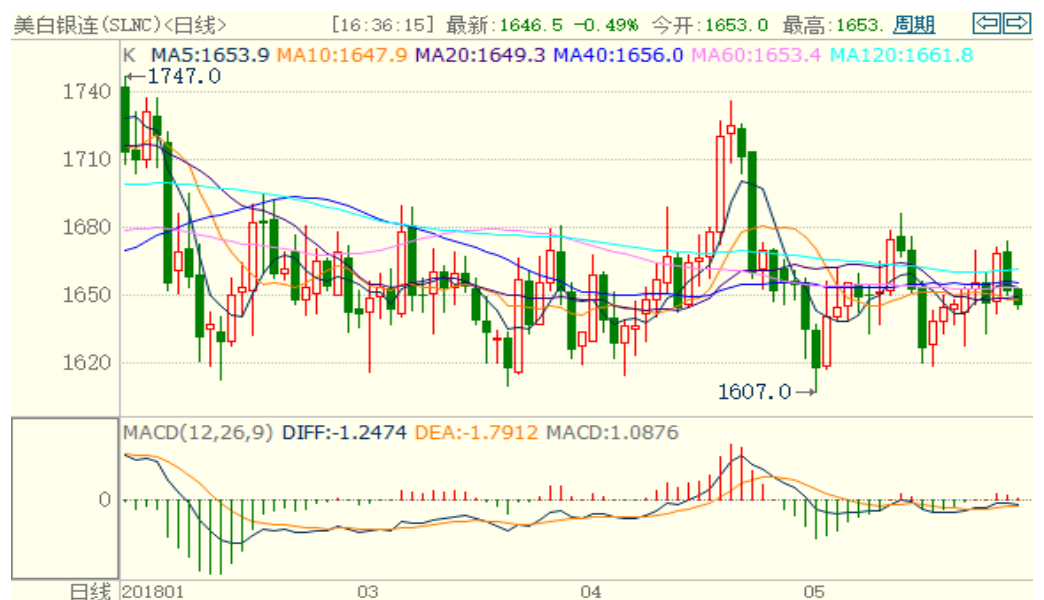
图 2：COMEX 白银主力合约技术分析