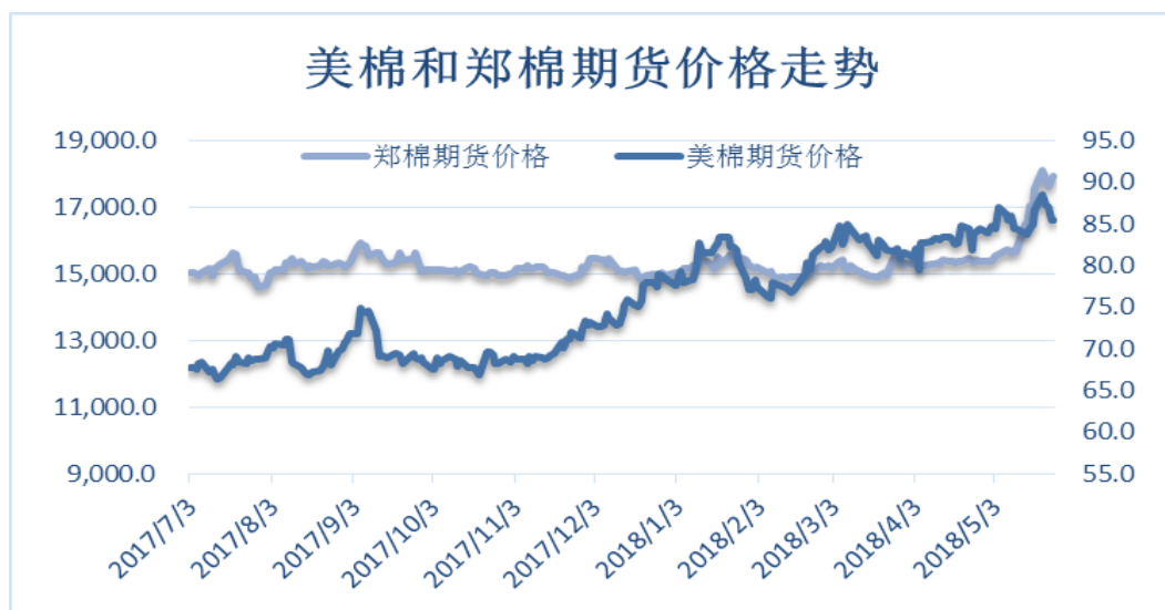
图 4、郑棉与美棉价格走势图