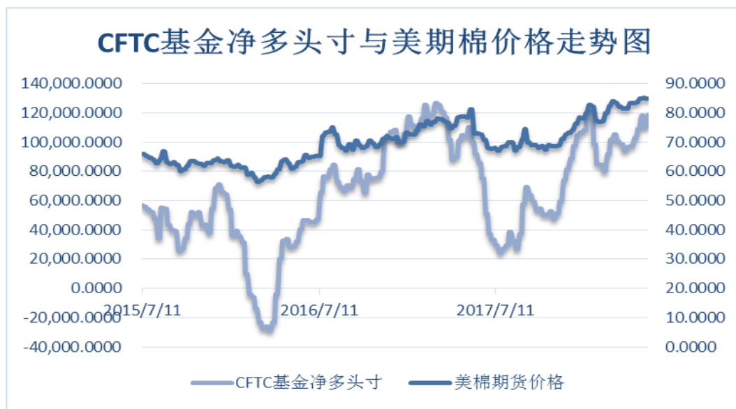
图 4、ICE 非商业净多头持仓

得州核心地区干旱且棉花需求较好继续推动棉花价格上涨，基金净多头持仓继续位于高位。