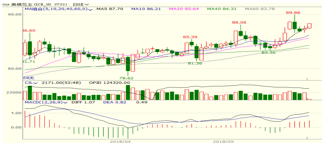
图 2、美棉主力合约价格走势

外盘，本周美棉上涨，至周五涨 2.71 至 89.29.58，涨幅为 3.13%。美棉播种加快且出口销售回落，棉价承压，但是美西南棉区旱情依旧，利多美棉市场。从技术面来看，MACD 红柱扩大，KDJ 向上，预计短期美棉可能继续震荡向上，但 90 美分附近存在一定的压力。