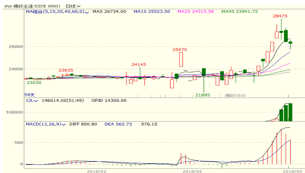
图 3、棉纱主力合约价格走势图

本周棉纱上涨，至周五涨 715 至 26275，涨幅为 2.80%，中国纱线价格指数 C32S 为 23600 元/吨，与上周相比上涨 250 元/吨。本周棉花上涨继续带动棉纱市场回温，近期下游纺企利润普遍好去往年，纱线需求较好，库存低位，支撑棉纱价格。从技术面来看，本周棉纱上涨后回落，MACD 红柱缩小，KDJ 向下，预计短期棉纱价格可能仍震荡调整后继续偏强走势。