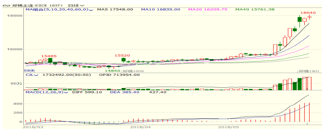
图 1、郑棉主力合约价格走势

本周，郑棉大幅上涨，至周五收盘涨 380 至 17080，涨幅为 2.28%。周五中国棉花价格指数为 16043 元/吨，与上周相比上涨 353 元/吨。本周国储棉轮出延续火热态势，且新疆部分地区遭遇降温与风灾，支撑棉价。从技术面来看，MACD 红柱缩小，KDJ 黏连，预计短期棉价可能震荡整理后继续偏强走势，支撑位 17300 附近。