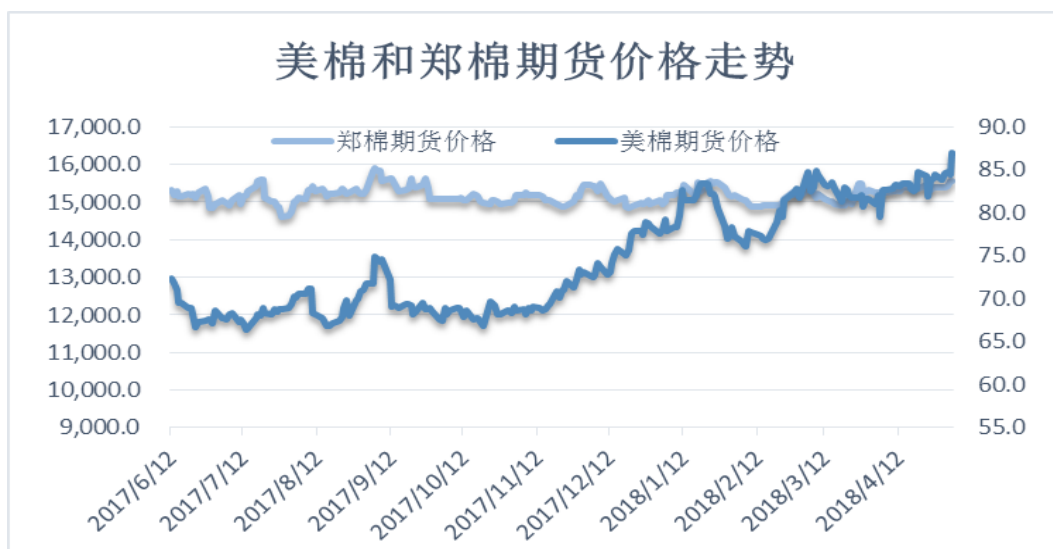
图 4、郑棉与美棉价格走势图