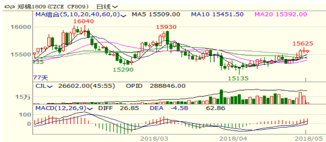
图 1、郑棉主力合约价格走势

本周，郑棉上涨，至周五收盘涨 180 至 15575，涨幅为 1.17%。周五中国棉花价格指数为 15465 元/吨，与上周相比上涨 12 元/吨。本周国储棉轮出成交率小幅回落但成交均价上涨，且新棉销售加快，支撑棉价。从技术面来看，MACD 红柱扩大，KDJ 向上，预计短期棉价可能震荡上涨，支撑位 15400 附近，压力位 16000 附近。