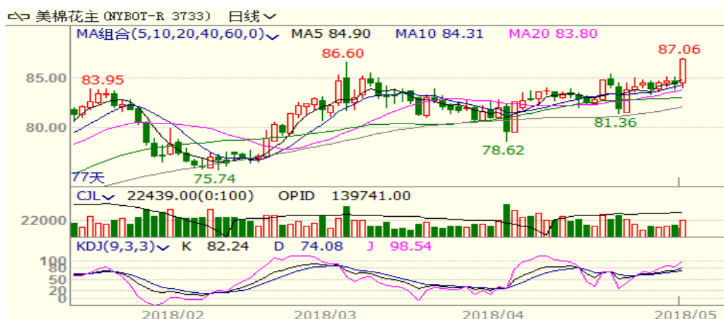
图 2、美棉主力合约价格走势

外盘，本周美棉向上突破，至周五涨 2.45 至 86.92，涨幅为 2.90%。美棉种植继续推进，但得州干旱影响棉花播种与生长，尽管上周美棉出口销售回落但是下游需求火爆且下年度签约量继续增长，支撑棉价。从技术面来看，MACD 红柱扩大，KDJ 向上，预计短期美棉可能继续震荡上涨。