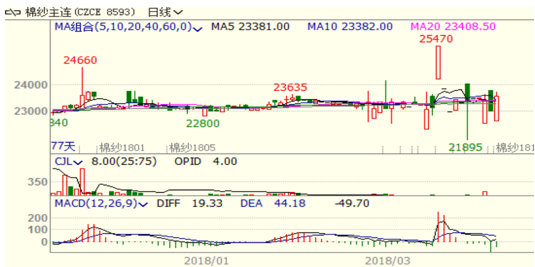
图 3、棉纱主力合约价格走势图

本周棉纱上涨，至周五涨 565 至 23545，涨幅为 2.46%，中国纱线价格指数 C32S 为 23110 元/吨，与上周相比上涨 10 元/吨。本周棉纱成交量较少，国内纺织印染成本上涨影响棉纱消费，但近期纱布产销率提升支撑棉纱价格。从技术面来看，本周棉纱上涨，MACD 绿柱缩小，KDJ 向上，随着棉花价格回升，预计短期棉纱价格可能震荡偏强。