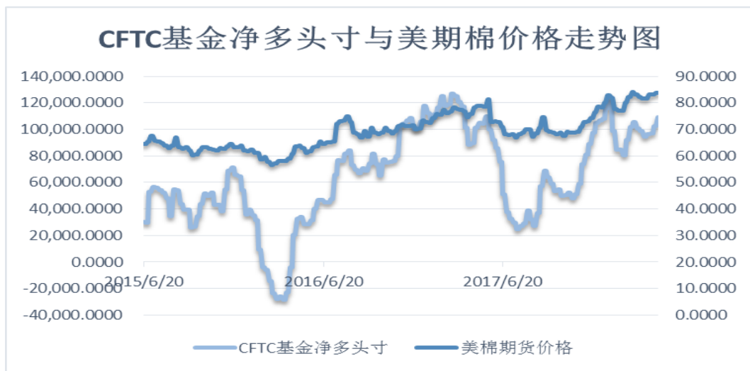
图4、ICE非商业净多头持仓