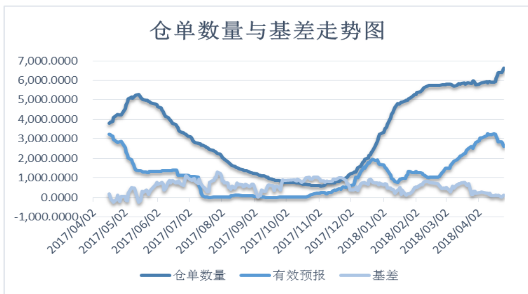
图 4、郑州商品交易所仓单数量