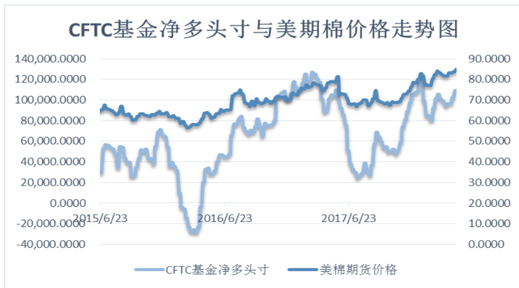
图 4、ICE 非商业净多头持仓