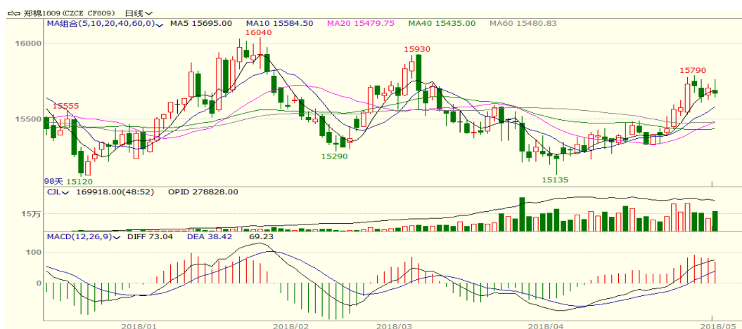
图 1、郑棉主力合约价格走势

本周，郑棉上涨，至周五收盘涨 95 至 15670，涨幅为 0.61%。周五中国棉花价格指数为 15525 元/吨，与上周相比上涨 60 元/吨。本周国储棉轮出成交率大幅回升但成交均价小幅下滑，且新疆地区遭遇降温，部分地区棉苗受损，支撑棉价。从技术面来看，MACD 红柱缩小，KDJ 向下，预计短期棉价可能震荡偏强，支撑位 15400 附近，压力位 16000 附近。