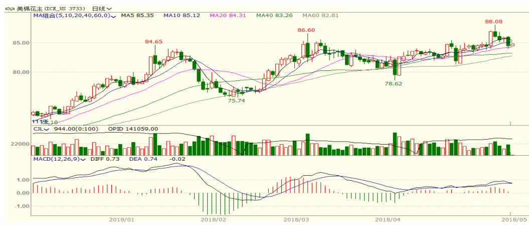
图 2、美棉主力合约价格走势

外盘，本周美棉下跌，至周五跌 2.46 至 84.46，跌幅为 2.83%。USDA5 月报告调增本年度美棉出口量，但低于市场预期，下年度中国以外地区库存升至新高，压制棉价，但出口销售与下年度减产依旧支撑棉花价格。从技术面来看，MACD 死叉，KDJ 向下，预计短期美棉可能震荡整理，支撑位 80 美分附近。