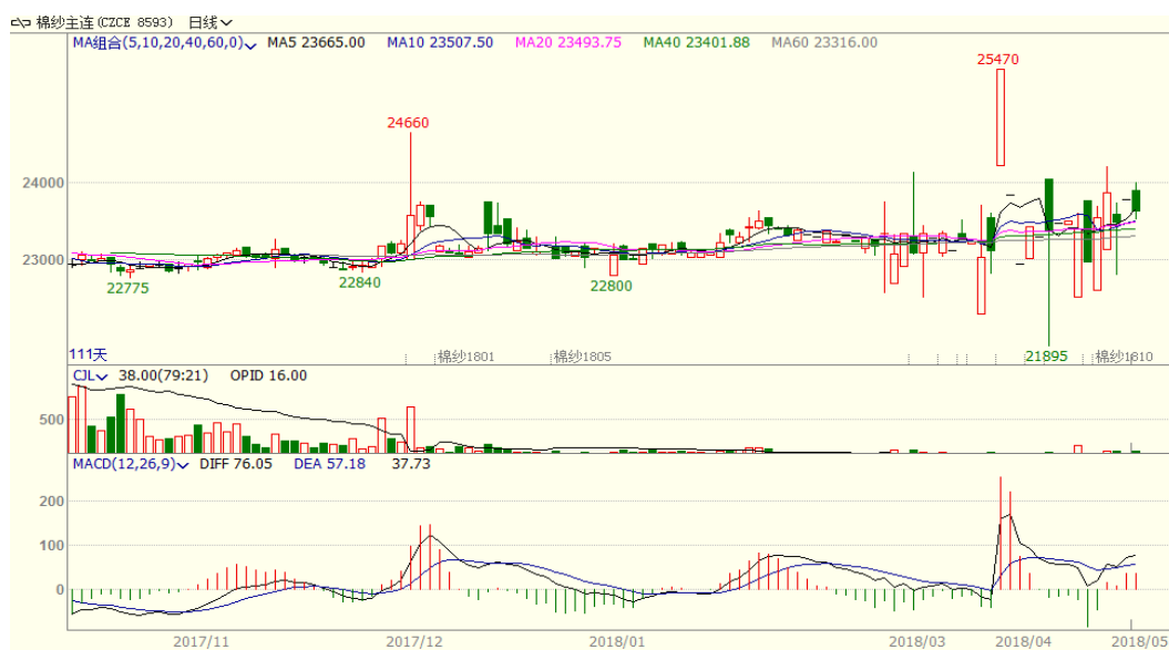
图 3、棉纱主力合约价格走势图

本周棉纱上涨，至周五涨 95 至 23640，涨幅为 0.40%，中国纱线价格指数 C32S 为 23160 元/吨，与上周相比上涨 50 元/吨。本周棉纱成交量较少，目前正值纺织行业的传统旺季，纱线需求较好，支撑棉纱价格。从技术面来看，本周棉纱上涨，MACD 红柱缩小，KDJ 向下，预计短期棉纱价格可能仍呈震荡偏强走势。