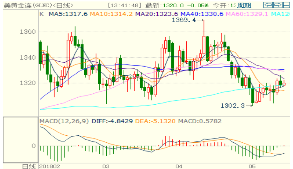
图 1：COMEX 黄金主力合约技术分析

COMEX 黄金上周震荡上涨，目前 MACD 指标偏多，预计本周价格震荡上涨。下方支撑位 1300 美元/盎司，上方目标位 1360 美元/盎司。