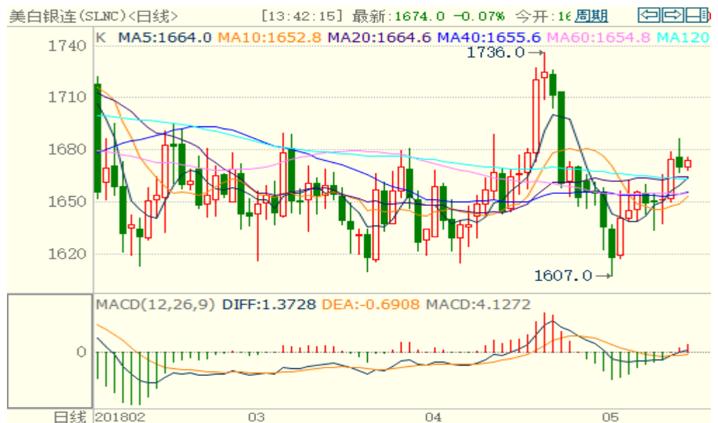
图 2：COMEX 白银主力合约技术分析

COMEX 白银上周也是震荡上涨，表现较黄金更强势，技术指标偏多，预计本周同样或震荡偏强。