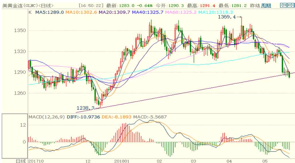
图 1：COMEX 黄金主力合约技术分析

COMEX 黄金上周大幅下跌跌破了 1300 的重要支撑位，目前在趋势线附近，若做多需要注意设置止损。下方支撑位 1250 美元/盎司，由于美元指数较为强势，黄金本周或震荡下跌，人民币金价或也震荡下跌。