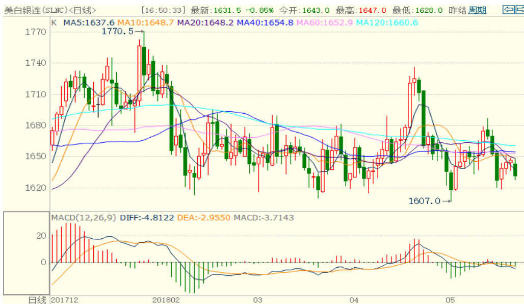
图 2：COMEX 白银主力合约技术分析