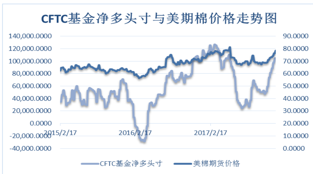
图 4、ICE 非商业净多头持仓

美棉出口销售保持强势，且市场存在对后续棉花质量的担忧，支撑美棉稳步上涨，基金净多头持仓大幅回升至相对高位。