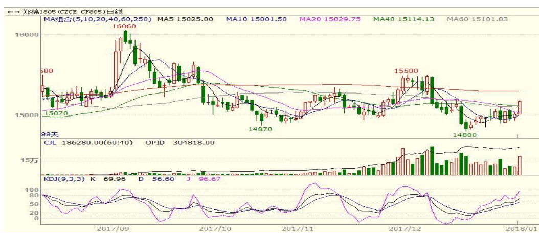
图 1、郑棉主力合约价格走势

本周郑棉上涨，至周五收盘涨 225 至 15170，涨幅为 1.51%。周五中国棉花价格指数为 15665 元/吨，与上周相比下跌 34 元/吨。本周郑棉上涨，新棉采摘交售基本结束，新花上市量继续增加，而皮棉销售依旧缓慢，市场观望气氛较浓，但是随着企业库存下降及新花价格回落，纺企补库意愿加强，支撑棉价。从技术面来看，MACD 绿柱缩小，KDJ 向上，预计棉价短期可能继续震荡上涨，支撑位 14600 附近，压力位 16000 附近。