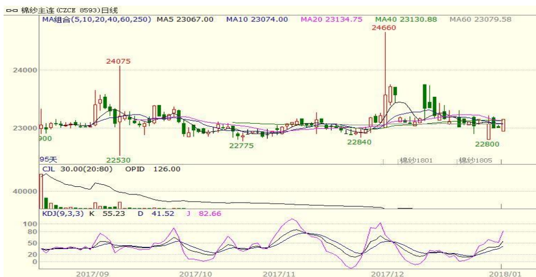
图 3、棉纱主力合约价格走势图

本周棉纱上涨，至周五涨 55 至 23155，涨幅为 0.24%，中国纱线价格指数 C32S 为 23010 元/吨，下跌 20 元/吨。本周棉纱上涨，目前为需求淡季，棉纱价格承压，但是近期进口纱价格持续回升，支撑国内棉纱价格。从技术面来看，本周棉纱小幅震荡上涨，但 MACD 绿柱再次扩大，KDJ 向下拐头，预计短期棉纱价格可能继续震荡，支撑位 22800 附近，压力位 23600 附近。