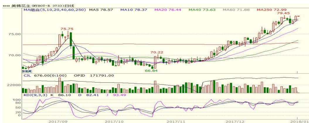
图 2、美棉主力合约价格走势

外盘，本周美棉震荡下跌，至周五跌 0.56 美分至 77.94 美分/磅，跌幅为 0.71%。本周美棉下跌，尽管美棉出口净签约量增加，但是 80 美分处压力较大，棉价回落。从技术面来看，MACD 死叉，KDJ 向下，预计短期美棉可能继续偏弱调整，阻力位 80 美分，支撑位 76 美分。