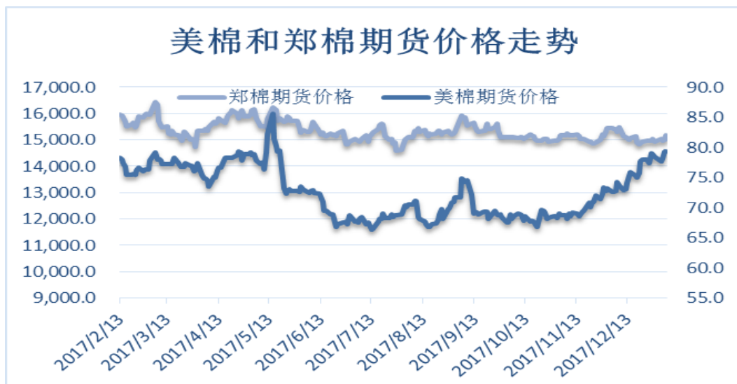
图 4、郑棉与美棉价格走势图