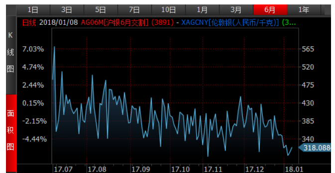
图 4、沪银 6 月-伦敦银 (RMB/kg) 溢价近期明显回落