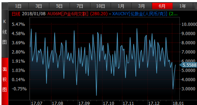
图 3、沪金 6 月-伦敦金 (RMB/g) 溢价近期明显回落

上周外盘黄金上涨 1.16%，人民币对美元继续升值 0.41%，导致国内黄金期货仅上涨 0.74%，国内期货对外盘现货的溢价也明显回落。国内白银上周上涨幅度较小，国内白银期货对外盘的溢价同样回落。国内金银的涨幅较小以及溢价回落，或与人民币对美元的持续升值有关。