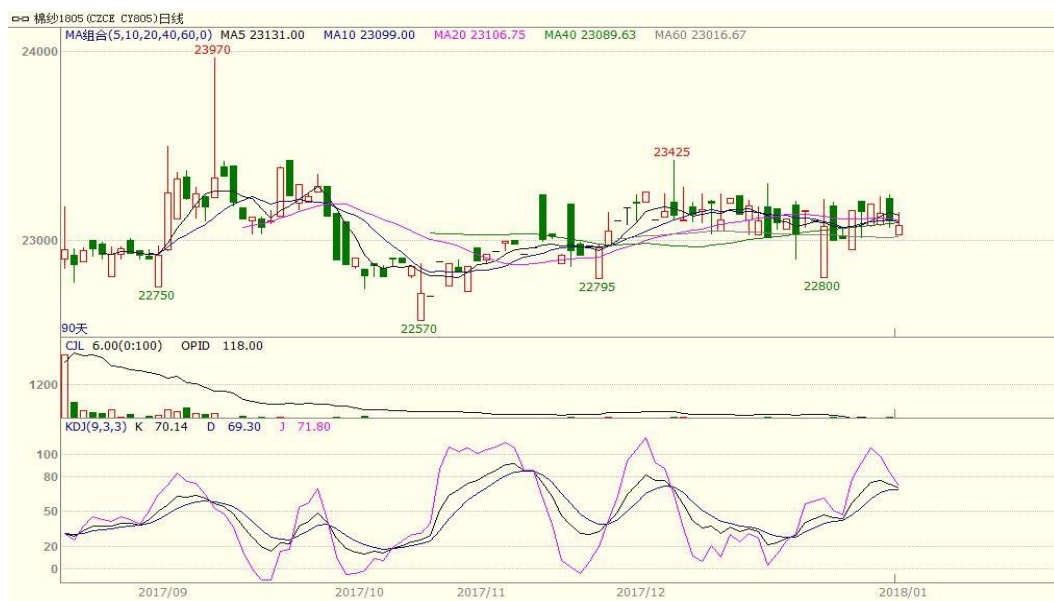
图 3、棉纱主力合约价格走势图

本周棉纱下跌，至周五跌 55 至 23100，跌幅为 0.24%，中国纱线价格指数 C32S 为 23000 元/吨，下跌 10 元/吨。本周棉纱下跌，目前为需求淡季，纱布产销率继续下滑，库存增加，棉纱价格承压，但是内外棉纱价格倒挂，支撑国内棉纱价格。从技术面来看，本周棉纱小幅震荡下跌，MACD 死叉，KDJ 趋于死叉，预计短期棉纱价格可能继续震荡，支撑位 22800 附近，压力位 23600 附近。