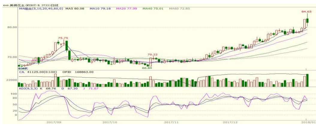
图 2、美棉主力合约价格走势

外盘，本周美棉大幅上涨，至周五涨 3.53 美分至 81.47 美分/磅，涨幅为 4.53%。本周美棉上涨，美棉出口销售强劲支撑棉价上涨，但是 USDA1 月产需预测报告小幅利空，棉价回落。从技术面来看，MACD 红柱扩大，但 KDJ 向下，预计短期美棉可能震荡调整，阻力位 85 美分，支撑位 76 美分。