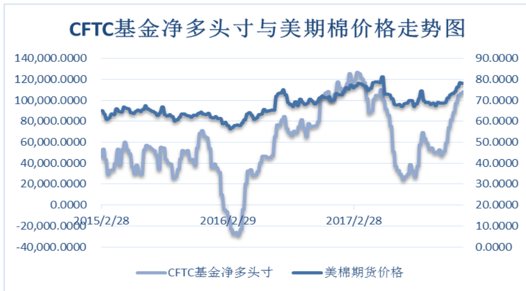
图 4、ICE 非商业净多头持仓