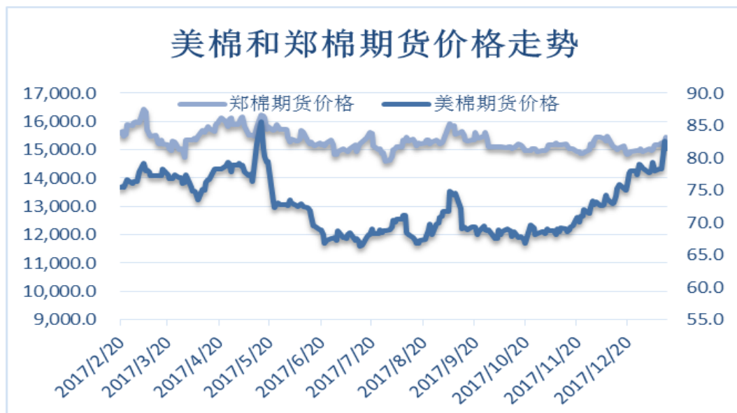
图 4、郑棉与美棉价格走势图