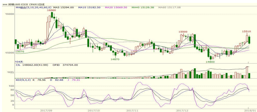
图 1、郑棉主力合约价格走势

本周郑棉上涨，至周五收盘涨 280 至 15450，涨幅为 1.85%。周五中国棉花价格指数为 15658 元/吨，与上周相比下跌 7 元/吨。本周郑棉上涨，新棉采摘交售基本结束，而新棉销售依旧缓慢，市场观望气氛较浓，但是随着企业库存下降及新花价格回落，纺企补库意愿加强，支撑棉价。从技术面来看，MACD 红柱缩小，KDJ 高位拐头，预计棉价短期可能震荡调整，支撑位 14600 附近，压力位 16000 附近。