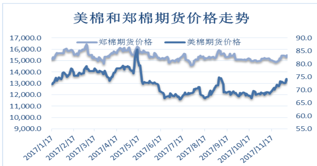
图 4、郑棉与美棉价格走势