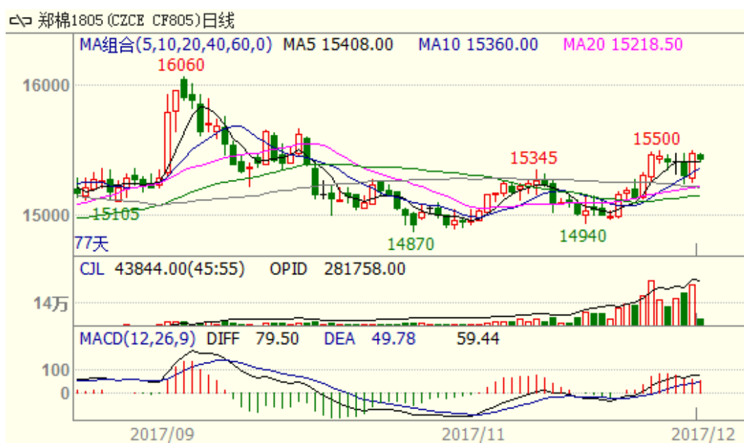
图 1、郑棉主力合约价格走势

本周郑棉上涨，至周五收盘涨 20 至 15480，涨幅为 0.13%。周五中国棉花价格指数为 15842 元/吨，与上周相比下跌 3 元/吨。本周郑棉上涨，新棉采摘交售接近尾声，皮棉销售依旧相对缓慢，轧花厂销售意愿加强，棉花价格承压，但是受全球棉价上涨带动，本周郑棉震荡上涨。从技术面来看，MACD 红柱扩大，但 KDJ 向下，预计棉价短期可能小幅震荡回落，支撑位 14600 附近，压力位 16000 附近。