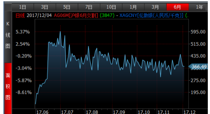
图 4、沪银 6 月-伦敦银 (RMB/kg) 溢价近期震荡下跌