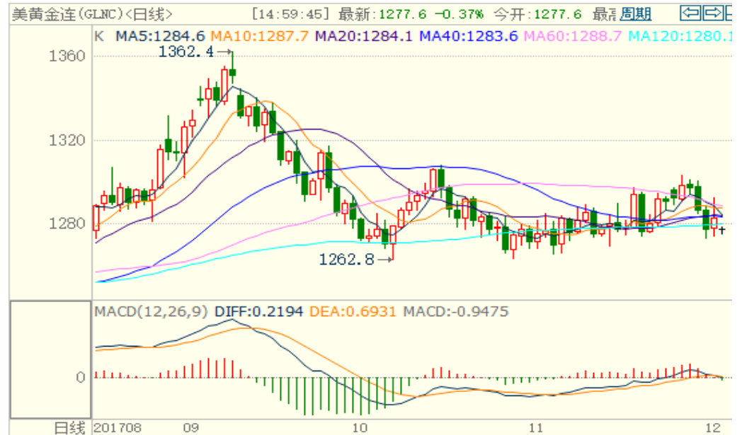
图 1：COMEX 黄金主力合约技术分析

COMEX 黄金上周先涨后跌周五上涨但本周一大幅低开，技术指标偏中性，预计本周黄金震荡小幅下跌，前低点 1262.8 为支撑位。