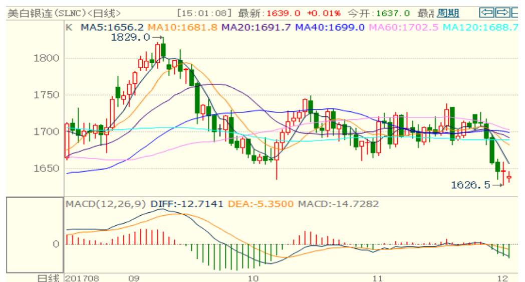
图 2：COMEX 白银主力合约技术分析

COMEX 白银上周大跌，技术指标偏空，前低点有一定的支撑，预计本周白银或同样震荡小幅下跌。