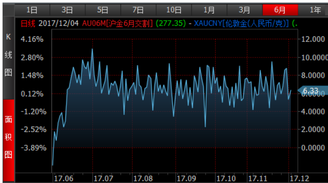
图 3、沪金 6 月-伦敦金 (RMB/g) 溢价近期持续震荡