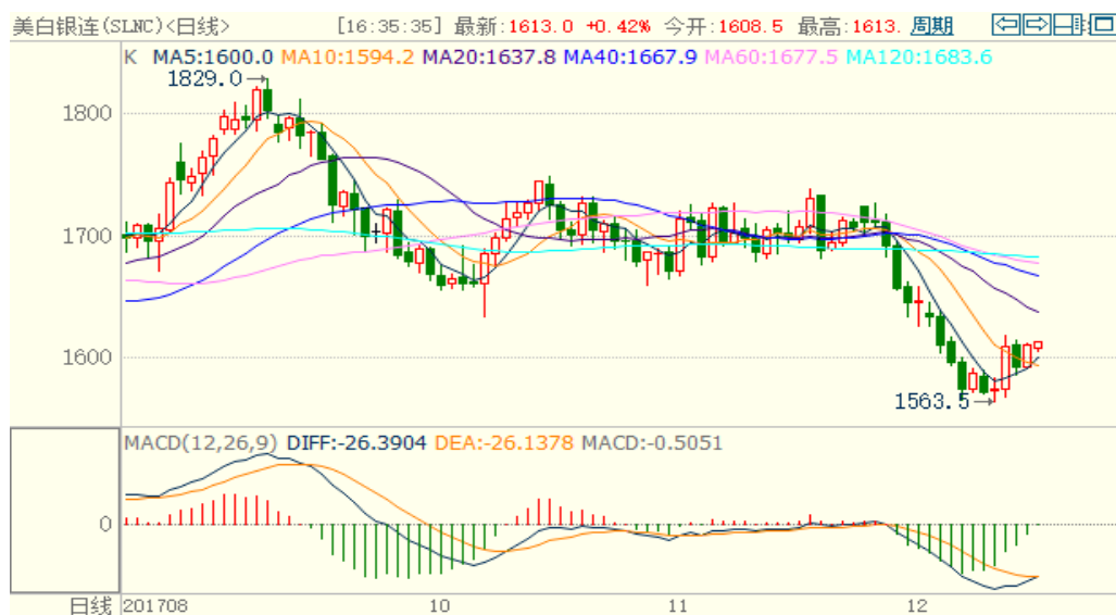
图 2：COMEX 白银主力合约技术分析

COMEX 白银上周同样先跌后涨，涨幅较黄金更大，技术指标偏多，预计本周白银或震荡上涨。