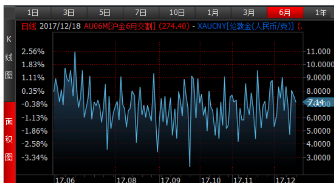
图 3、沪金 6 月-伦敦金 (RMB/g) 溢价近期持续震荡

上周黄金涨幅不大，白银上涨明显。人民币对美元的汇率波动非常小。从图上看，内外盘价差基本保持震荡，没有明显的趋势行情。