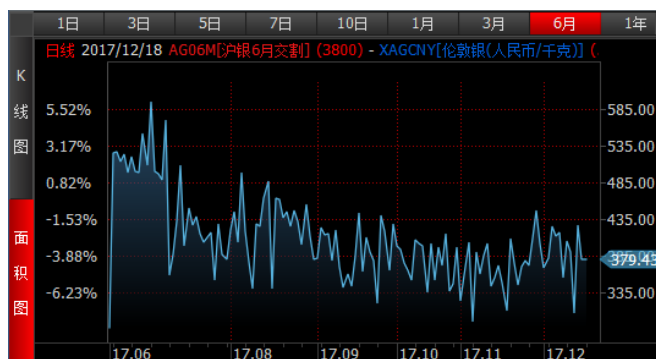
图 4、沪银 6 月-伦敦银 (RMB/kg) 溢价近期维持震荡