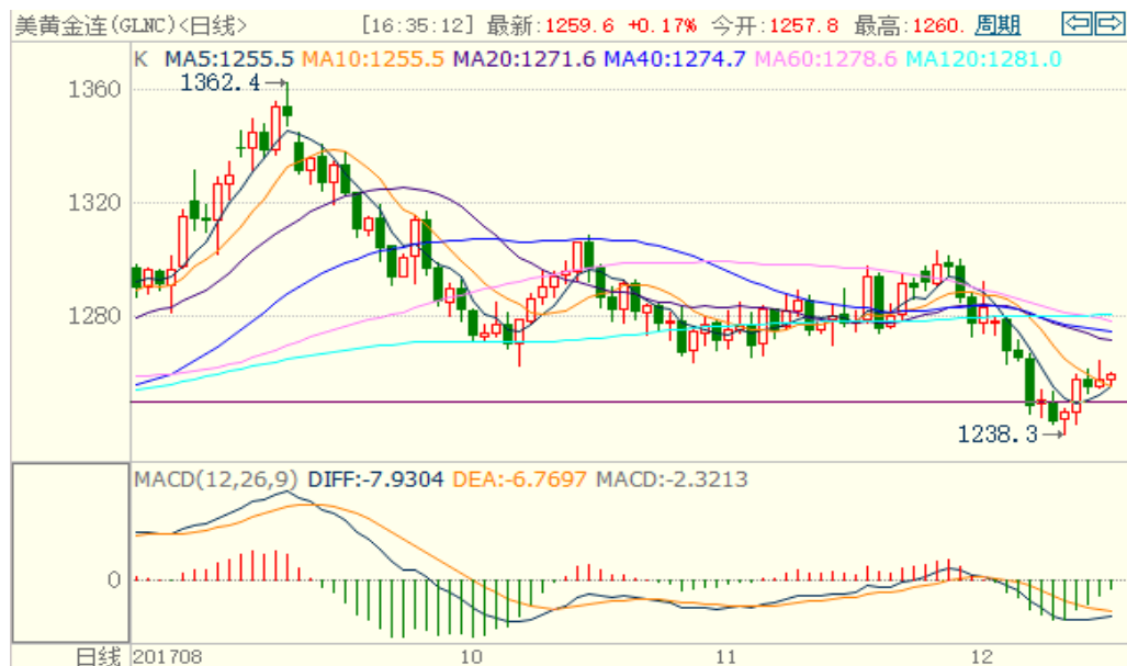
图 1：COMEX 黄金主力合约技术分析

COMEX 黄金上周先跌后涨，主要是受到鸽派加息的提振，技术指标偏多，支撑位 1250 美元/盎司，预计本周或震荡上涨。