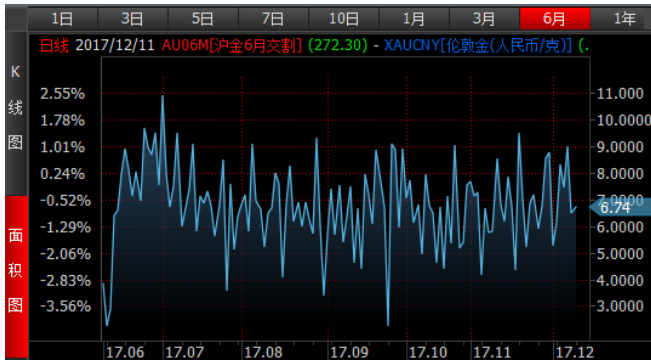
图 3、沪金 6 月-伦敦金 (RMB/g) 溢价近期持续震荡