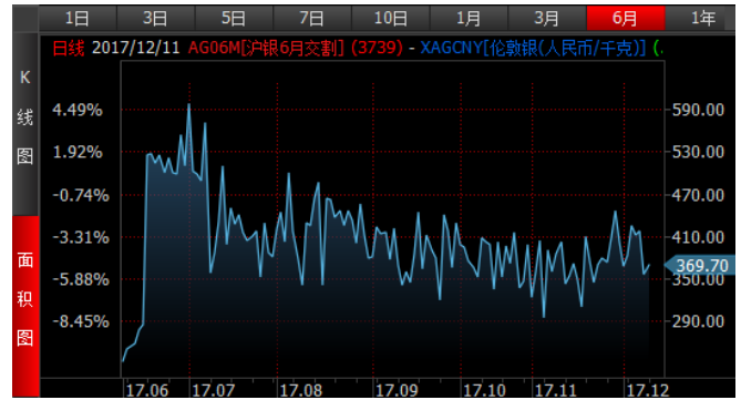
图 4、沪银 6 月-伦敦银 (RMB/kg) 溢价近期略微走高