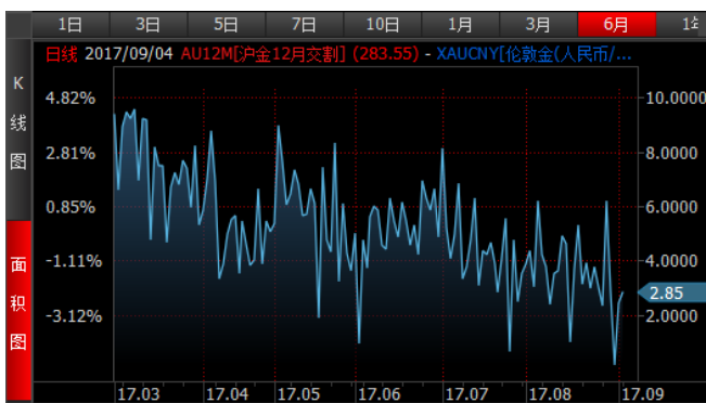
图 3、沪金 12 月-伦敦金 (RMB/g) 溢价近期震荡回归

美元指数上周变动不大，人民币对美元近期呈现加速升值的走势，或与国内经济表现强劲等有关。本周人民币对美元或仍有升值空间，或将继续缩小国内金銀的涨幅。