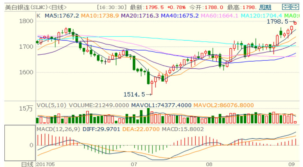
图 2：COMEX 白银主力合约技术分析