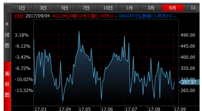
图 4、沪银 12 月-伦敦银 (RMB/kg) 溢价近期震荡回落