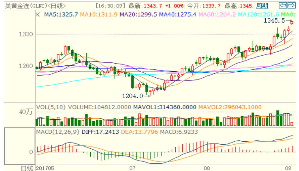
图 1：COMEX 黄金主力合约技术分析

COMEX 黄金上周大幅震荡上涨，周一在朝鲜核试验的影响下高开高走，预计本周黄金或仍震荡上涨，上方压力位 1350、1380 美元/盎司，人民币对美元或继续升值，将缩小国内黄金的涨幅。