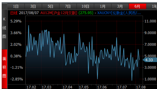
图 3、沪金 12 月-伦敦金 (RMB/g) 溢价近期低位震荡

上周金银的内外盘价差走势较为一致，均为上涨后回落，或因市场对非农数据预期不一致所致。但从较长周期看，金银的价差均为宽幅震荡，趋势不明显。