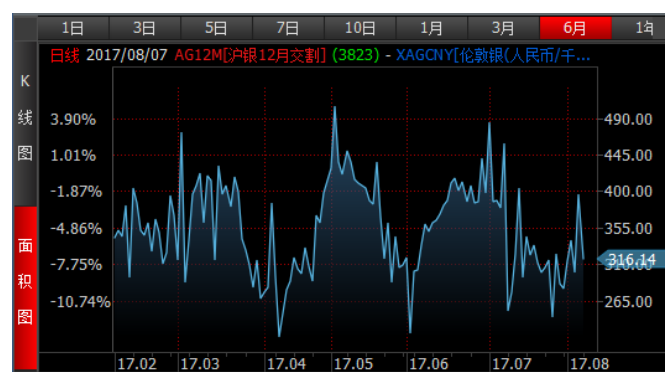
图 4、沪银 12 月-伦敦银 (RMB/kg) 溢价近期宽幅波动