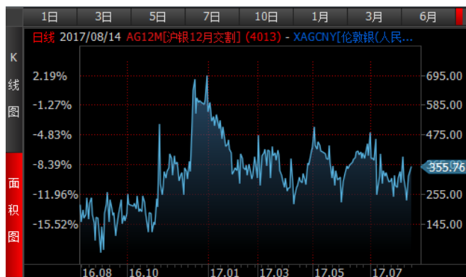
图 4、沪银 12 月-伦敦银 (RMB/kg) 溢价近期宽幅波动