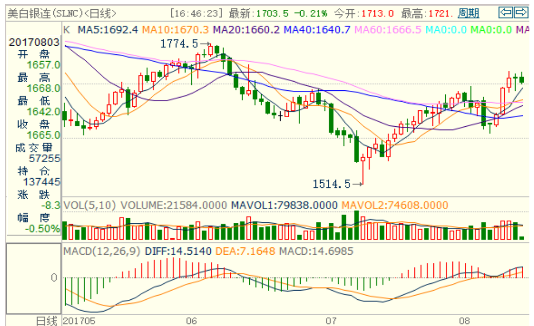
图 2：COMEX 白银主力合约技术分析