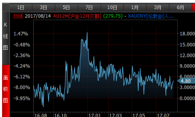
图 3、沪金 12 月-伦敦金 (RMB/g) 溢价近期低位震荡