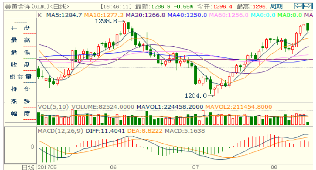
图 1：COMEX 黄金主力合约技术分析

COMEX 黄金上周大涨接近 1300 美元/盎司的压力位，技术指标偏空，上涨动能或减弱，本周黄金或震荡偏空。