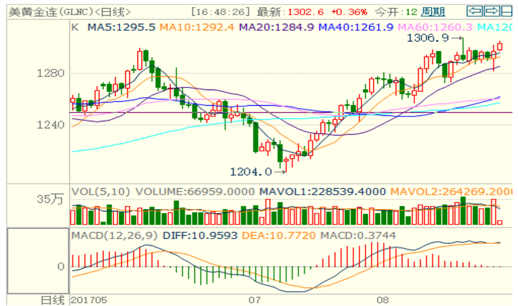
图 1：COMEX 黄金主力合约技术分析

COMEX 黄金上周横盘震荡，本周一向上突破 1300 美元/盎司，中线方向为上涨，但短期 MACD 技术指标显示上涨动能有所减弱，本周或仍有回调的风险。