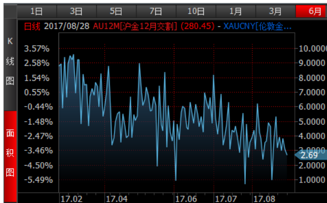
图 3、沪金 12 月-伦敦金 (RMB/g) 溢价近期震荡回归