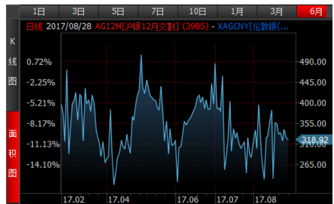
图 4、沪银 12 月-伦敦银 (RMB/kg) 溢价近期宽幅波动